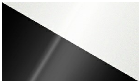
Crystal White/Phantom Black